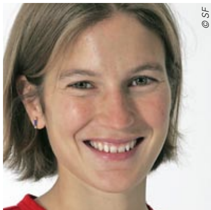
Simone Niggli-Luder, OL-Weltmeisterin

■ Der dritte Faktor war seine Bereitschaft zu lernen und seine Schwächen zu akzeptieren. So sehr er maulte und knurrte ob der Last, die Gott ihm auferlegt hatte, er spürte auch, dass Gott ihm helfen wollte, seine Grenzen zu erweitern. So wurde aus dem aufbrausenden ägyptischen Jüngling ein alter, weiser Mann. Unzählige Male hat er versagt, hat gezweifelt und den Weg zurück zu Gott gefunden.