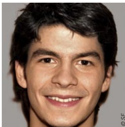
Stéphane Lambiel – charmanter Weltmeister

gekliegt. Immerhin hat er seine Haut gerettet. Seine Karriere hatte einen Knick bekommen, aber jetzt lebte er zufrieden vor sich hin. Zwar in der Fremde und ein Mörder war er immer noch, aber er lebte wenigstens in Freiheit. Plötzlich wurde seine Ruhe gestört durch einen Gott, der von ihm verlangte, dass er zurück nach Ägypten ging, um sein Volk in die Freiheit zu führen. Was soll denn das werden?